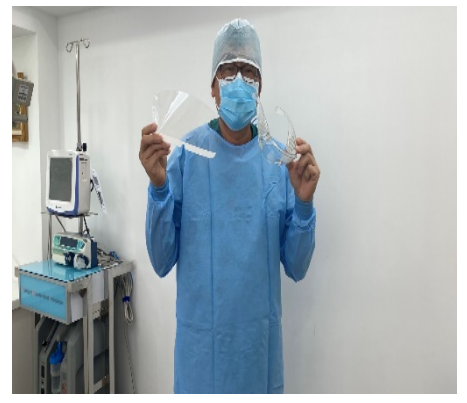
3. 脫除面罩或護目鏡