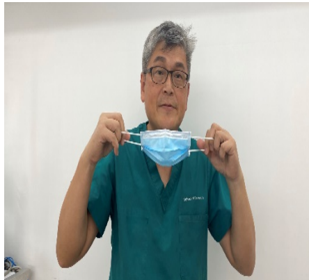
8. 脫除醫療用外科口罩